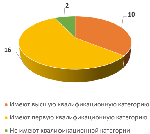
Сведения о квалификации педагогических кадров